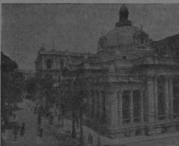
Una calle moderna en el barrio europeo de la ciudad de Shanghai, que fue, según el cable, tomada antes por los revolucionarios, sin ninguna resistencia.

En Nankin, los rebeldes fueron derrotados. Forma radical para evitar dificultades