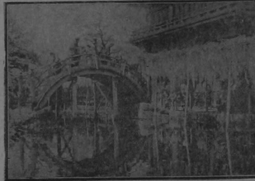
Un rincón poético