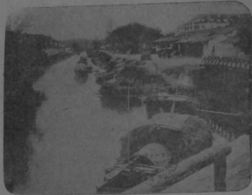
Un barrio de la ciudad de Shanghay, hoy en poder de los revolucionarios. Al fondo se ve el observatorio meteorológico de los jesuitas.